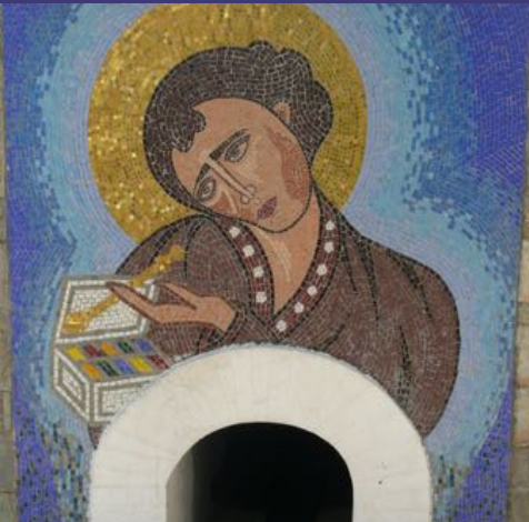
Bron in Stes