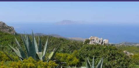
Uitzicht vanaf Stes

Het kleinere gedeelte van het huis wordt opgedeeld in twee delen: