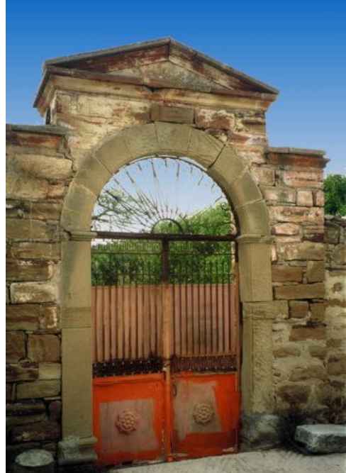
Typische Kambos poort

Maar misschien heeft u liever een fris biertje? Daarvoor kunt u terecht bij de lokale bierbrouwerij Chios beer, Agios Minas 78, Kambos.